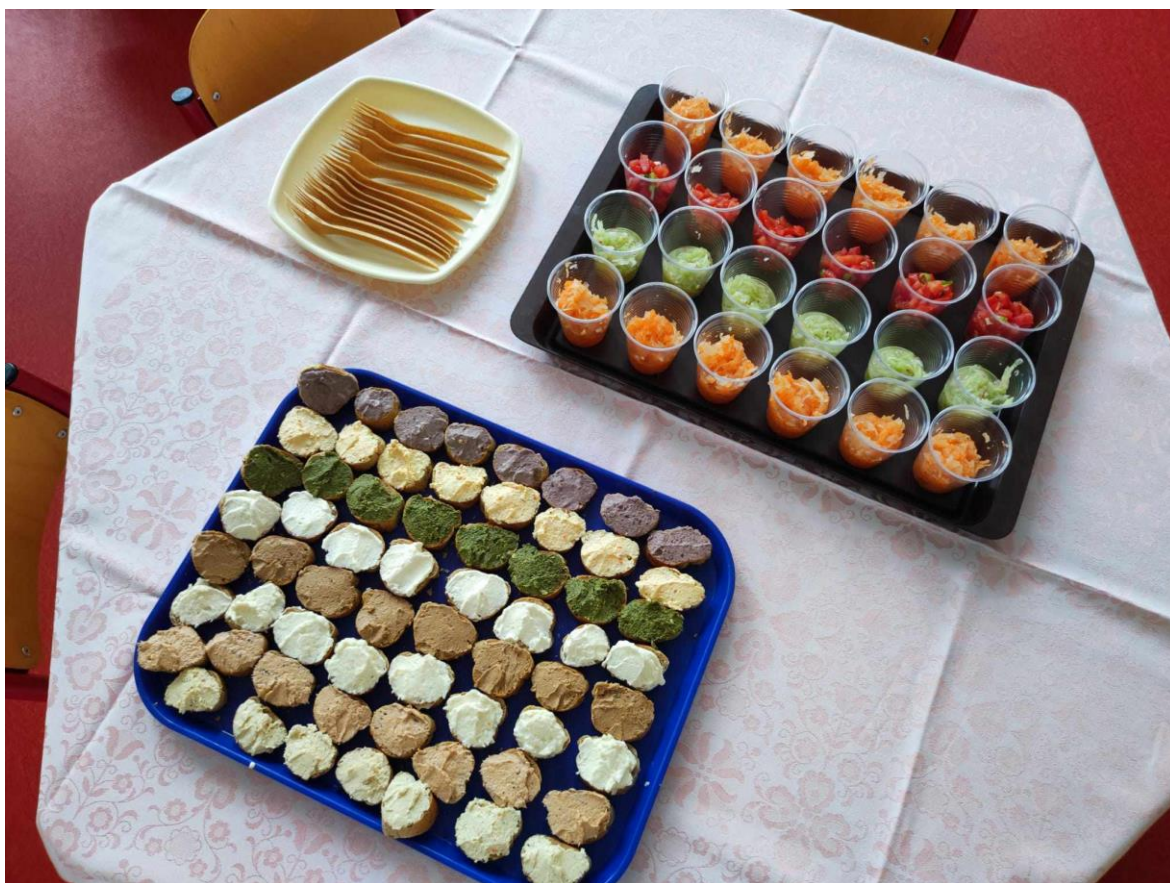
Ochutnávka – den otevřených dveří