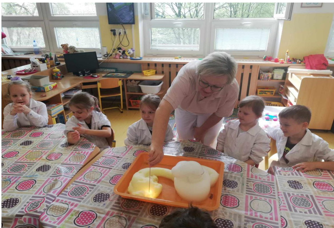
Projekt malý badatel – spolupráce s SPŠCH