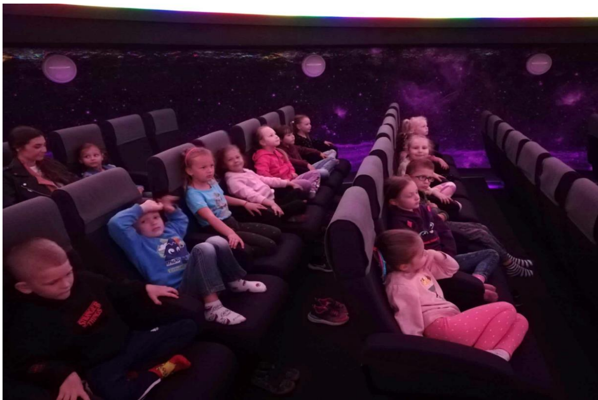
Planetárium v rámci projektu Malý badatel