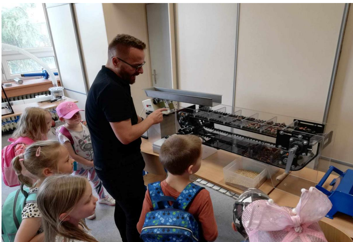
Projekt Malý badatel – VŠB