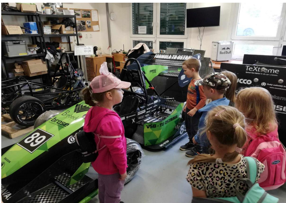
Projekt Malý badatel – návštěva VŠB